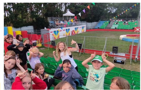
LE SÉJOUR À MIMIZAN