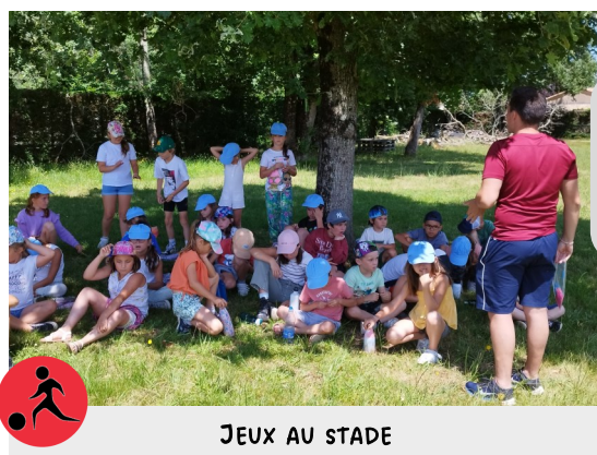
JEUX AU STADE