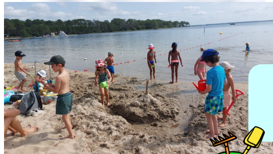
LES BAINADES À BOMBANNES

2 spectacles proposés par les enfants le 26 juillet sur le thème des JO et le 30 Août sur le thème du Cinéma