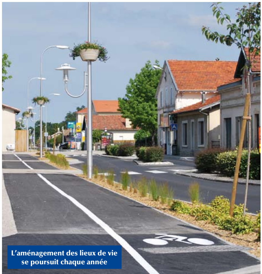
L'aménagement des lieux de vie se poursuit chaque année

Ce «point d'étape» possède également un intérêt pratique pour la seconde partie du mandat, en facilitant les choix à venir, en s'interrogeant sur les causes des (rares) actions non encore engagées, en mesurant le temps nécessaire entre la décision et la concrétisation ; de même, il permet aux Carcanais d'avoir une vision synthétique de l'action municipale.