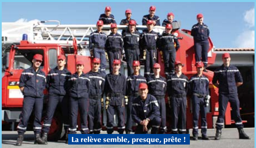
La relève semble, presque, prête !