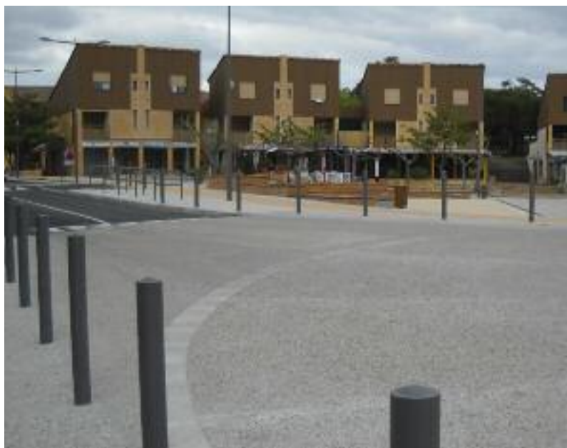
Ci-dessus : rue centrale et place du Pôle en harmonie - Ci-dessous : les enfants ne sont jamais oubliés