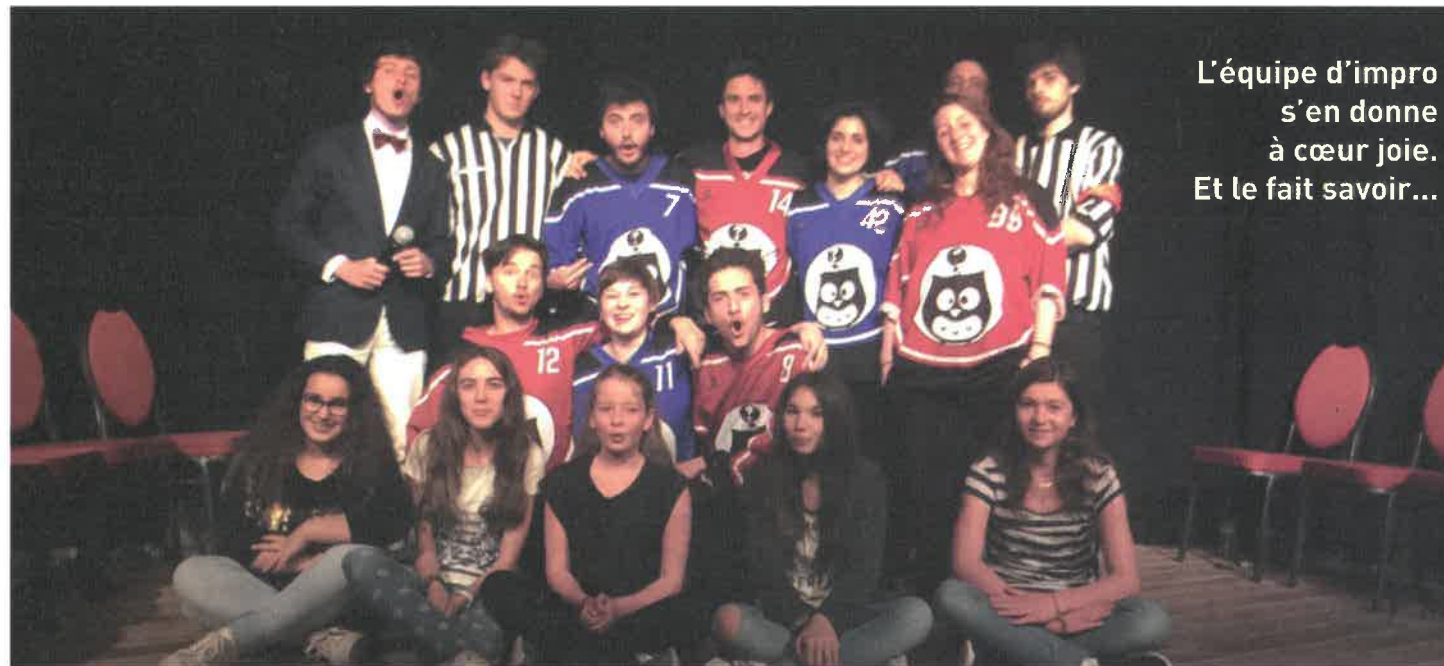
L'équipe d'impro s'en donne à cœur joie. Et le fait savoir...